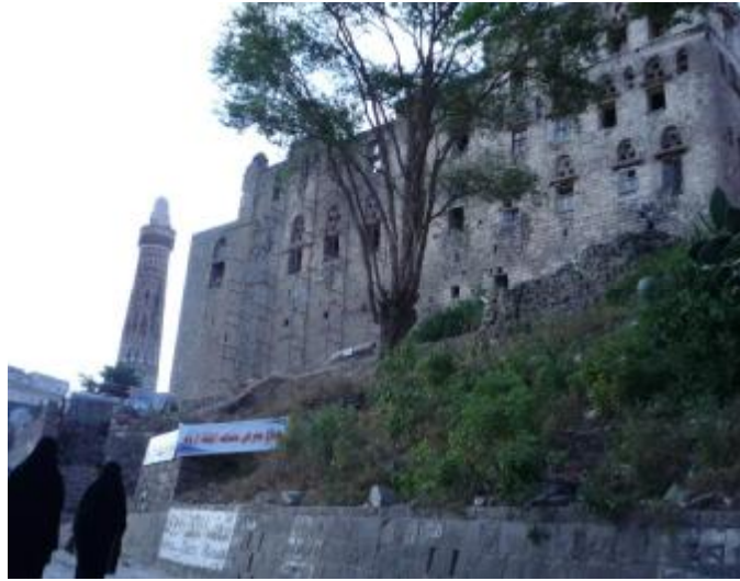
ترميم قصر الملكة أروى ذي 360 غرفة بمدينة جدة - إب

المتصدعة. وتم كذلك معالجة جزء من الجدار الغربي من الركن الشمالي، حيث كان يعاني من أضرار متعددة بسبب الهبوط المتفاوت وانحناء الجدار نحو الخارج بمقدار أكبر من المسموح به في الجدران الحاملة. كما تناولت أعمال التدعيم والترميم الركن الشمالي الغربي للتعامل مع الأضرار والتصدعات التي أدت إلى عدم استقراره بفعل الترميمات السابقة غير الملائمة وكذا بسبب عدم ترابط البناء.