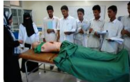
تدريب طلاب معهد ناصر الصحي - عدن

تم تطوير ثلاثة مشاريع لبناء وتجهيز مراكز صحية في مديرتي المظفر والقاهرة بمحافظة تعز ومديرية ميفعة بشبوة.