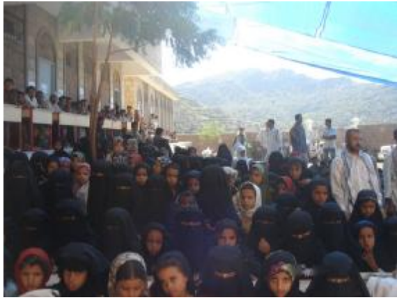
التوعية بأهمية تعليم الفتاة أحد مكونات التدخل المتكامل - عزلة الأساودة - تعز

تم تنفيذ ورشة تقييمية على مدى 4 أيام لكل من رؤساء أقسام ومختصي المشاركة المجتمعية وتعليم الفتاة لتفعيل دور مجالس الآباء والأمهات في كافة مدارس البرنامج. كما تم الانتهاء من تأنيث 9 مدارس في مناطق مختلفة للبرنامج.