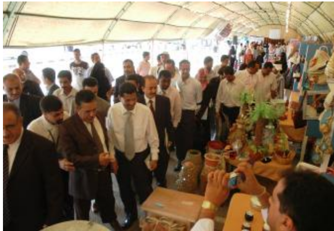
إفتتاح الفعالية السادسة لأيام المنشآت الصغيرة والأصغر بعدن

** جميع ورش العمل في مشاريع الدعم المؤسسي للمنظمات المجتمعية والتجمعات المحلية *** يشمل التدريب جميع المجالس المحلية في مختلف محافظات الجمهورية (330 مجلساً محلياً تقريباً)