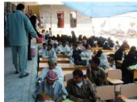
جانب من أنشطة تمكين المجتمعات المحلية - الحلية - الحديدة

الاستفادة منها. وهذا البرنامج يتيح للمؤسسات الحكومية وغير الحكومية تحسين أداء العاملين في المشروعات المختلفة، وإيجاد نواة محترفين في إدارة المشاريع وفق متطلبات المعهد العالي لإدارة المشاريع (PMI).. وذلك من خلال التعرف على أحسن الممارسات العالمية في إدارة المشاريع، وكيفية تطبيقها وإسقاطها على المشروعات الحقيقية في الواقع.. وقد أعقبها دورة متابعة في 31 ديسمبر 2009، قام خلالها المتدربون باستعراض ومناقشة المشاريع التي كانوا قد أعدوها وفقاً للمنهجية التي درّبوا عليها في الدورة السابقة.