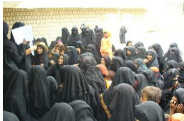
انتخاب ممثلات في المجموعات الريفية الانتاجية - المحويت

يتم تنفيذ أربع دورات تدريبية ميدانية لمدة تسعة شهور لتأهيل معلمات محو الأمية في أربع مناطق للتدخل المتكامل في (الخصم-ريمه (26 معلمة) والبعجة-الحديدة (27 معلمة) و بني مبارز- إب (16 معلمة) والأساودة-تعز (14 معلمة).