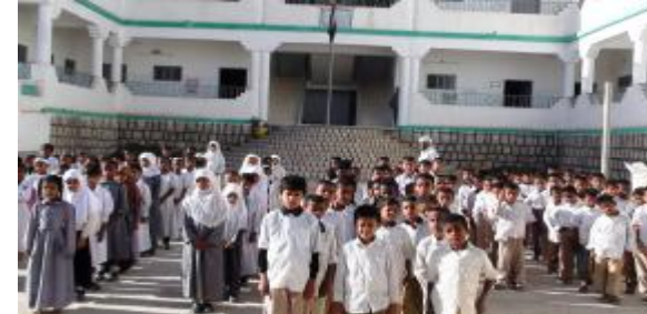
مدرسة علي بن أبي طالب - مدينة القطن - حضرموت

تمت الموافقة، خلال الربع على 9 مشاريع، يستفيد منها 7,256 شخصاً استفادة مباشرة (منهم 6,504 إناث). وشملت تلك المشاريع برامج التعليم الأساسي (6 مشاريع)، ودعم سياسات وتوجهات تعليمية (مشروعان)، والتعليم قبل المدرسي (مشروع واحد). بالإضافة إلى عدد من ورش العمل وحلقات التدريب في مجالات تتعلق بالبرامج الأخرى.