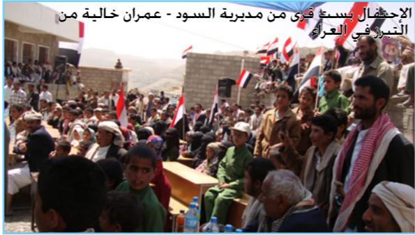
الإحضان بسيف قرى من مديرية السودة - عمران خالبة من التنوير في العراء

بجامعة صنعاء، وتأهل من المتدربين 60 متدرّباً ومتدربة. ومن الأنشطة التي نفذت في إطار منهج الصرف الصحي التام بقيادة المجتمع والتي تجسد أثر المنهج في تغيير السلوك تم في 29/5/2010م إعلان ست قرى في مديرية السودان كقرى نموذجية في الصرف الصحي والقرى هي بيت حازب، مقنع، بيت الولي، بيت الراحي، بيت العنص وبيت المؤيد. وحضر الحفل الإخوة وكيل محافظة عمران لقطاع البيئة والأخ رئيس وحدة المياه والبيئة بالصندوق الاجتماعي ومدير فرع الصندوق بعمران وعضو مجلس النواب وأعضاء السلطة المحلية الممثلين لمديرية السودان وأيضاً في 7/6 / 2010 م تم البدء بتنفيذ المرحلة التجريبية لحملات التوعية بمنهجية الصرف الصحي الكامل بقيادة المجتمع بواسطة أهالي القرى التي أعلنت نموذجية في الصرف الصحي في كل من محافظات تعز واب وعمران وبمعدل عشر قرى في كل محافظة. وكذلك خلال الفترة من 6/30-26 تم في فرع الصندوق بتعز تنفيذ دورة تدريبية على تنفيذ منهج الصرف الصحي الكامل بقيادة المجتمع، حيث تم تدريب 32 استشاري (12 اناث و20 ذكور) بالإضافة إلى خمسة ضباط مشاريع.