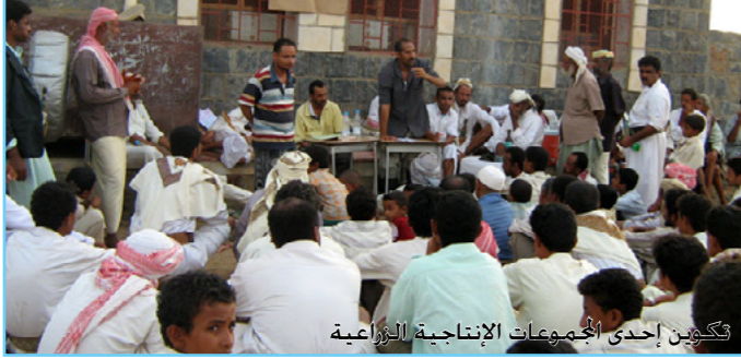
تكوين إحدى المجموعات الإنتاجية الزراعية

تناولت العديد من المجالات والموضوعات تناولت 2 منها مجالي البيطرة وزراعة وإنتاج الزيتون في كل من إب وصنعاء على التوالي، شارك فيها ما يزيد عن 60 مزارعاً ومزارعة ومرشداً زراعياً، في حين تناولت 4 منها دورات تدريبية لاستشاريي الفروع في مجالات تكوين المجموعات الإنتاجية وبناء قدراتها في كل من حجة والحديدة وصنعاء وعدن، شارك فيها 150 استشارياً واستشارية وتم الاستعانة بهم في تنفيذ أنشطة المكون الثالث من الزراعة المطرية. كما انتهى القطاع خلال شهر يونيو من تنفيذ دورتي تدريب في مجال إعداد وتنفيذ حملات التوعية الإرشادية شارك فيها 60 مشاركاً ومشاركة للاستعانة بهم في تنفيذ 5 حملات توعية إرشادية في 10 مديريات من 5 محافظات يعمل فيها مشروع الزراعة المطرية.