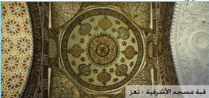
قبعة مسجد الأشرفية - تعز